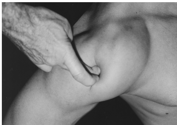
Figura 11.11. Cyriax en la inserción deltoidea